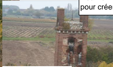
COMMUNE DE CINQ MARS LA PILE PILE DE CINQ MARS " Les Hauts de la Pile "